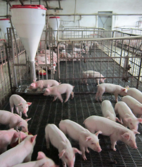
De meeste grotere bedrijven houden vandaag vooral Deense en Nederlandse rassen.