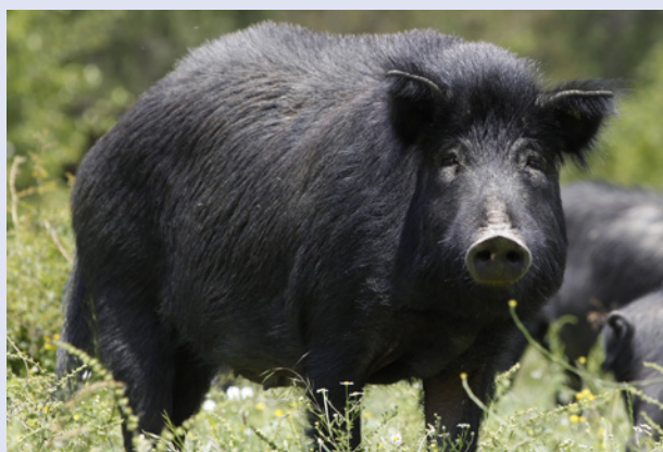
Tot het midden van de 20 ste eeuw was het Oost-Balkanvarken nog het belangrijkste varkensras in Bulgarije. Vandaag zijn er nog zo'n 1.500 zeugen.