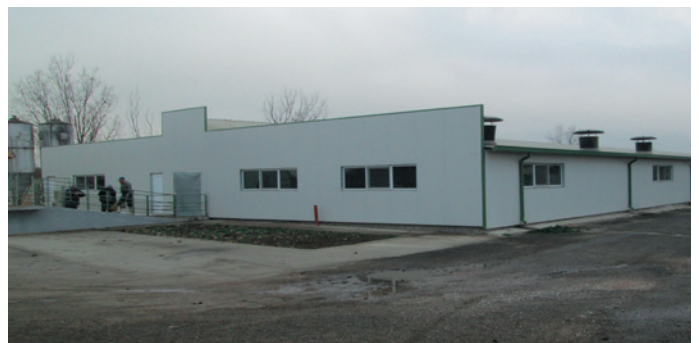
Vanaf 2004 werden grote coöperatieve varkenshouderijen opgericht maar ook grotere privé bedrijven.

Bulgarije is een Balkanland, gelegen aan de Zwarte Zee (ten oosten), die met zijn wereldhaven Varna, erg belangrijk is voor de Bulgaarse economie en landbouw. Naar het westen toe grenst het aan Servië en Montenegro, ten noorden aan Roemenië, in het zuiden aan Griekenland en ten zuidoosten aan Turkije. Het land is met een oppervlakte van 111.000 km 2 bijna viermaal zo uitgestrekt als België en 2,5 maal Nederland. Het landbouwareaal is echter amper 30.000 km 2 . Bulgarije telt 7,1 miljoen inwoners, tegenover 7,36 miljoen in 2011. Het bevolkingsaantal loopt dus achteruit, veel jongeren verlaten immers het land.