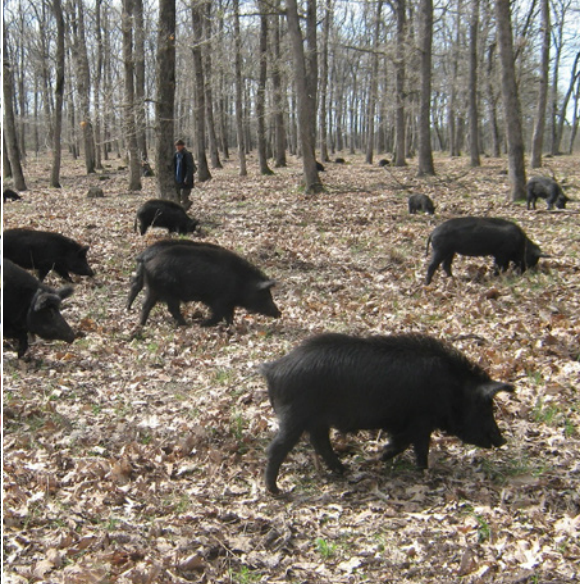
Oost-Balkanvarkens worden in kudden gehouden en in de natuur gehoed.