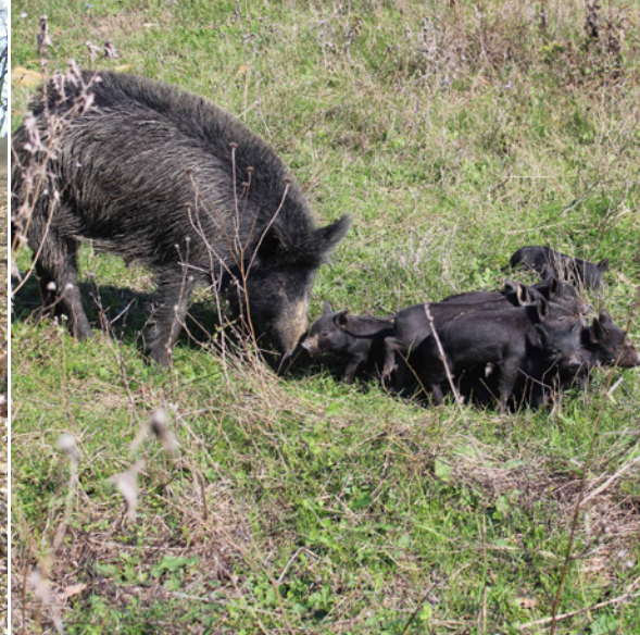
De reproductiviteit ligt laag maar het moederinstinct is sterk.

geleide landbouwbedrijven werkten, konden zich moeilijk aanpassen aan de Westerse landbouwconomie.