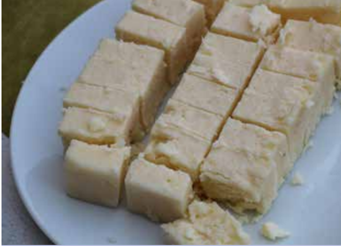
De Turken verbruiken veel witte kaas.