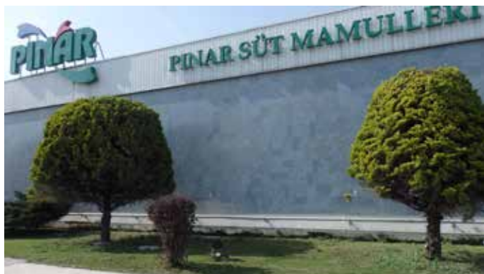
Pinar Süt is met 17 procent marktleider voor drinkmelk en met 12 procent marktleider voor kaas.

Een groot probleem voor de Turkse melkveehouderij is de zeer onstabiele melkprijs. De voerkosten liggen, gezien de beperkte teelt van ruwvoer op de boerderij, vrij hoog. In mei 2015 bedroeg de melkprijs gemiddeld 55 eurocent per liter, maar die is inmiddels gedaald.