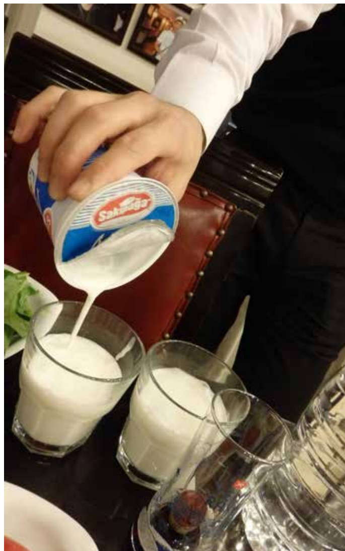
Na kaas met 32 procent en roomijs (24 procent) is ook yoghurt (18 procent) een belangrijk zuivelsegment.

In 2012 voerde Turkije voor 199 miljoen euro zuivelproducten uit en het importeerde voor 93,7 miljoen euro. In 2013 steeg de export echter met 23 procent tot 249 miljoen euro exportwaarde. De import steeg tot 116 miljoen euro. Turkije voert vooral uit naar Irak, Saudi-Arabië en andere landen in het Midden-Oosten, Afrika en ook Oost-Europa. De EU is de belangrijkste importeur maar de import wordt kunstmatig laag gehouden door het heffen van hoge importtarieven.