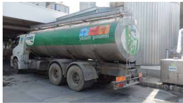
Na Unilever zijn er enkele belangrijke Turkse spelers zoals Sütas, Pinar Süt en AK Gıda.